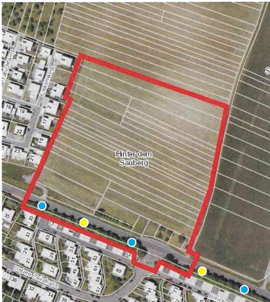
Abbildung 1: Flst. Nr. 596/2 Gemarkung Kleinsachsenheim Beispiele für geeignete Standorte zum Anbringen von Nisthöhlen für baumhöhlenbewohnende Vogelarten (blau = Typ Schwegler 1 B, 0 26 mm, gelb = Typ Schwegler 1 B, 0 32 mm)