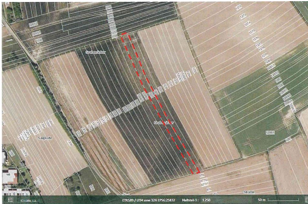
Abbildung 3: CEF-Maßnahme CEF 2 - Anlage von Buntbrachen - Kleinsachsenheim, Flst. Nr. 1227, Gemarkung Kleinsachsenheim, Größe : 1.309 m 2