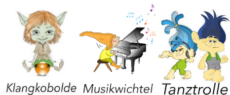
Klangkoblde Musikwichtel Tanztrolle

Unser Einrichtungsname „Klopferle“ geht auf die alte Sage des Schlossgespenstes zurück, das im Wasserschloss auf alten Fässern musizierte und so manch einer heute noch hören kann. „Klopferle“ spiegelt sowohl unsere Verbundenheit zu der Stadt Sachsenheim als auch unseren pädagogischen Schwerpunkt „Musik und Rhythmik“ wieder. Auch unsere Gruppennamen nehmen Bezug auf unser Profil und Fabelwesen.