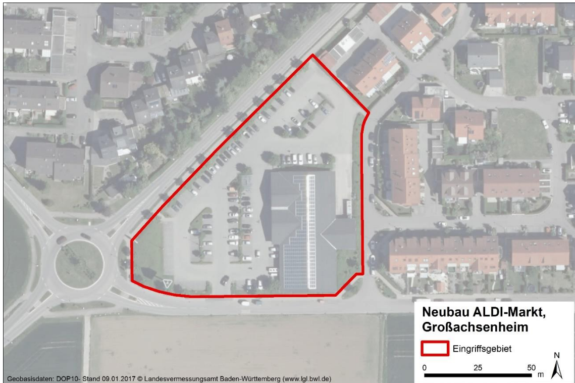
Abbildung 2: Lage des Eingriffsgebietes des Vorhabens Entwicklung einer ALDI-Filiale mit KiTa in Großsachsenheim.

Das Untersuchungsgebiet befindet sich südlich in Großsachsenheim im Landkreis Ludwigsburg. Der Standort wird gemäß der naturräumlichen Gliederung (HUTTENLOCHER & DONGUS 1967) dem Naturraum Neckarbecken zugeordnet.